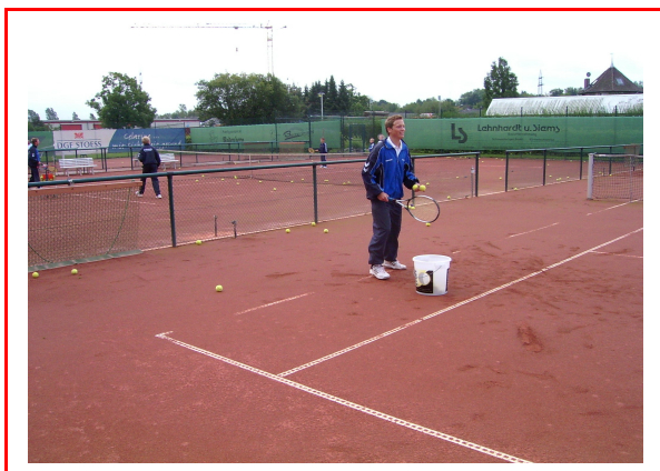
Unsere schöne Vereinsanlage mit 3 Plätzen

Wir haben zurzeit ca. 140 Mitglieder und freuen uns auf Euren Besuch. Interessierte Gäste, Tennisspieler, Kinder und Jugendliche sind jederzeit auf unserer Tennis-Anlage willkommen.