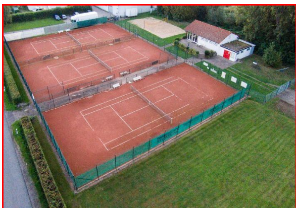
Unsere schöne Vereinsanlage mit 3 Plätzen

Wir haben zurzeit ca. 100 Mitglieder und freuen uns auf Euren Besuch. Interessierte Gäste, Tennisspieler, Kinder und Jugendliche sind jederzeit auf unserer Tennis-Anlage willkommen.